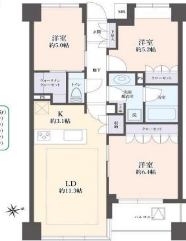
※LDの点線部は床暖房