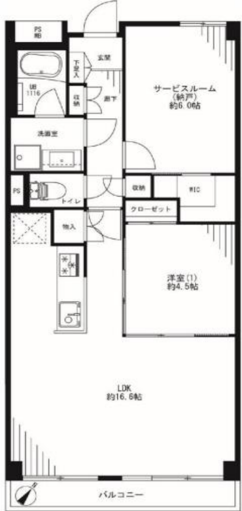
(この図面は概略図で現状と異なる場合があります)

リノベーション内容(令和4年8月完成予定) ■ユニットバス交換 (浴室乾燥機機能付) ■システムキッチン交換 ■給湯器交換 (追い焚き機能付) ■トイレ交換(温水洗浄便座付) ■洗面化粧台交換 ■全建具交換 ■網戸張替 ■フローリング張替 ■照明新規設置 ■ダウンライト新規設置 ■壁・天井クロス張替 ■洗濯用防水パン交換 ■玄関壁一部エコカラット施工 ■給水管・給湯管(室内)交換 ■ハウスクリーニング 等 ※アフターサービス保証付き(当社規定による)