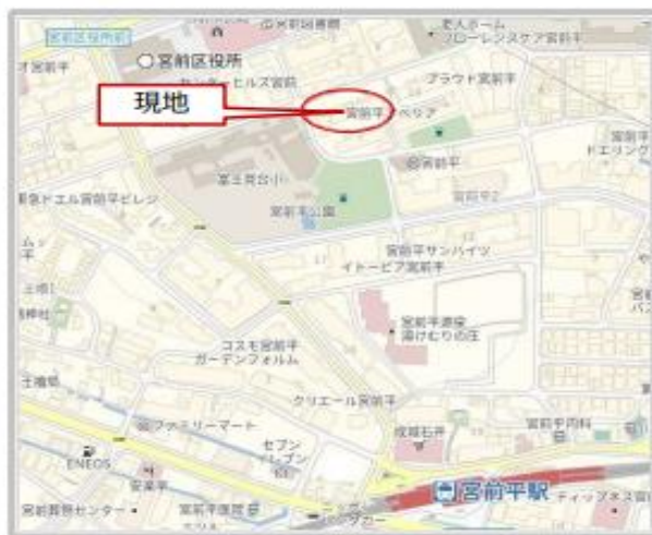
【カーナビ:川崎市宮前区宮前平2-10-1】